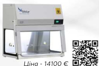
Ціна - 14100 €