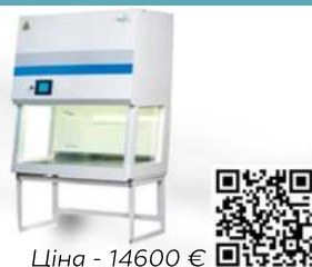
Ціна - 14600 €