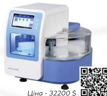
Ціна - 32200 $