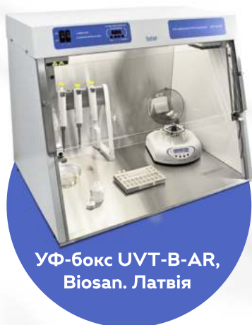
УФ-бокс UVT-B-AR, Biosan. Латвія