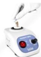
Центрифуга "LMC-3000", Biosan, Латвія