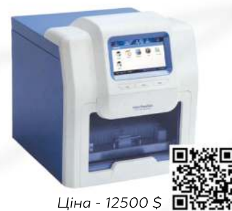
Ціна - 12500 $