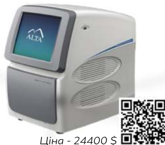
Ціна - 24400 $

Ампліфікатор в режимі реального часу "CFX96", Bio-Rad, США • Заводська прекалібровка оптики • Запатентована технологія оптичної системи «човник» • Прилад сумісний з готовими тест-системами різних виробників • По CFX Manager дозволяє проводити аналіз експресії генів і кількісну оцінку генетичного матеріалу кількох інфекційних агентів в десятках зразків