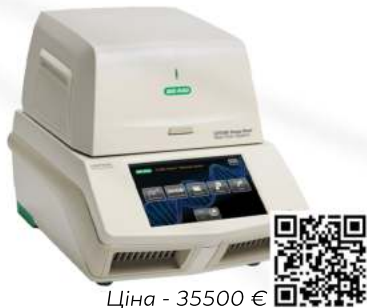
Ціна - 35500 €