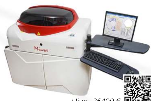
Ціна - 26400 €