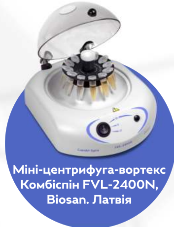
Міні-центрифуга-вортекс Комбіспін FVL-2400N, Biosan. Латвія