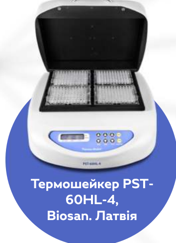
Термошейкер PST-60HL-4, Biosan. Латвія