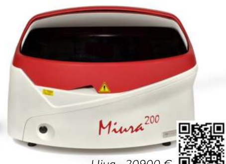
Ціна - 20900 €