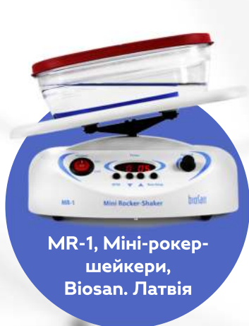
MR-1, Міні-рокер-шейкери, Biosan. Латвія