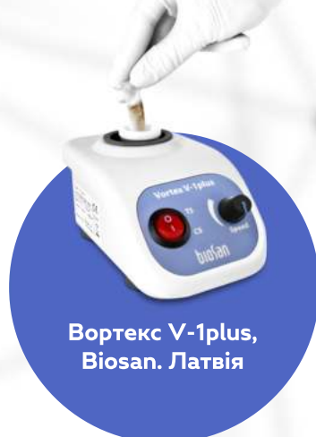
Вортекс V-1plus, Biosan. Латвія