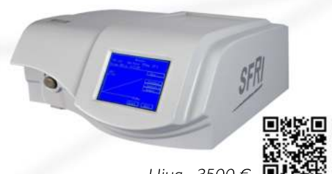
Ціна - 3500 €

Автоматичний біохімічний аналізатор "MIURA 300", I.S.E. SRL, Італія • Продуктивність- 300 тестів/год. • Іоноселективний блок (ІСБ) - Інтегрований (опція) (Na+, K+, Cl-, Li+) • РЕАГЕНТИ - 49 позицій • Постійне охолодження • ПРОБА - 59 позицій для зразків, калібраторів та контролей • РЕАКЦІЙНА СИСТЕМА - 80 багаторазових вимірювальних кювет • Об'єми реакційної суміші 200-500 мкл • Вимірювання: Кінетика, кінцева точка, фіксований час, диференціювання