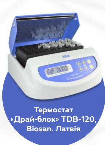
Термостат «Драй-блок» TDB-120, Biosan. Латвія