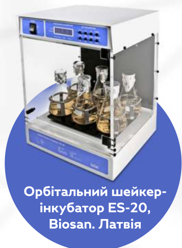
Орбітальний шейкер-інкубатор ES-20, Biosan. Латвія